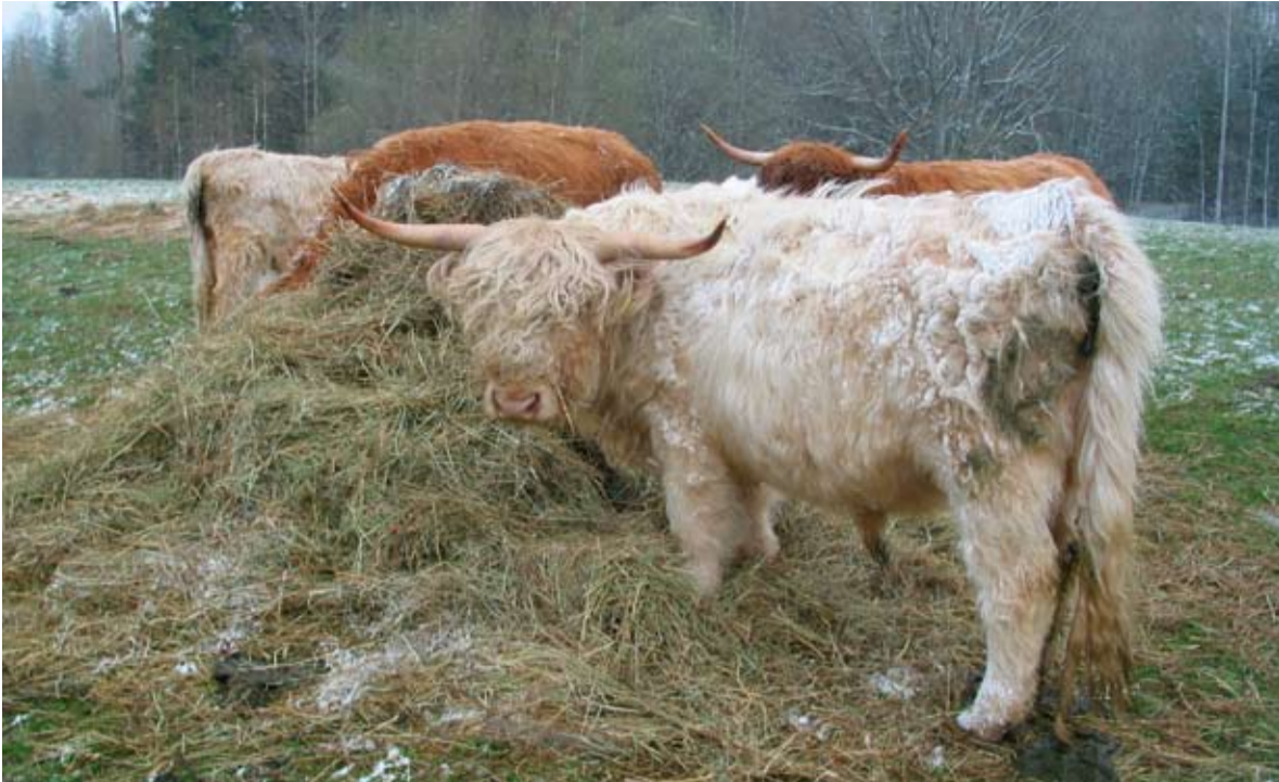
Eesti kirjajale-punikule pole roovõrsed mokkamööda, seepärast tuleb rannaniitide pügajaiks transportida šoti mägiveised. Neid imelise karvakasukaga veiseid võis pärnulanane imetleda suve lõpukuul Papiniidu all.