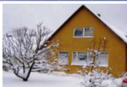
„Moonika“ loodud turvakardinad.