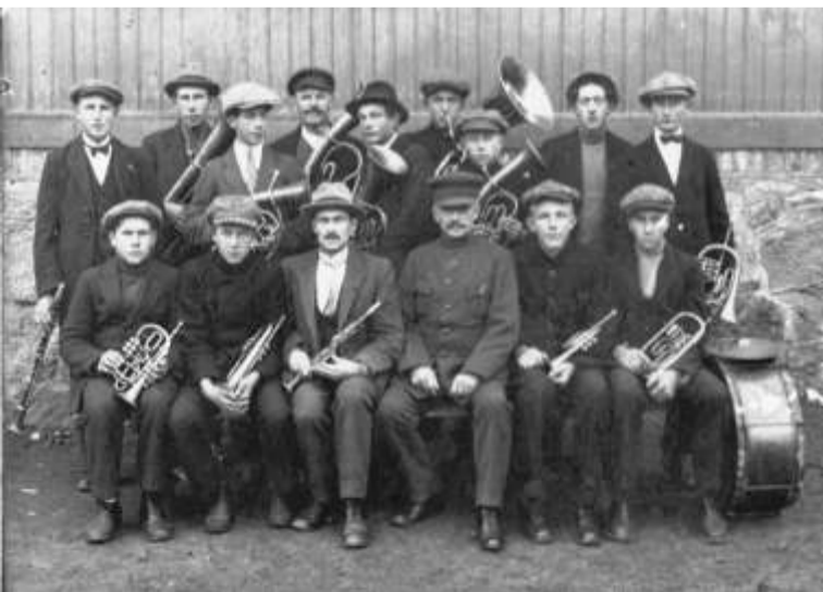
Palume abi! Kes on pildil? Info saatke postiga Lembitu 1, 80028 Pärnu aadressil või e-postiga ajaleht@raekylavanakool.ee.