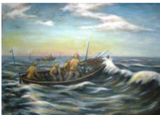
Suurele püügile, 1982, õli