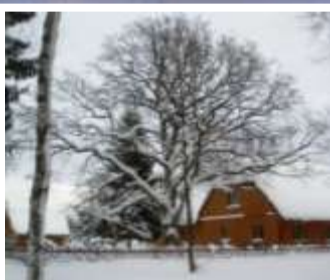
Talutare Kalevi puiesteel