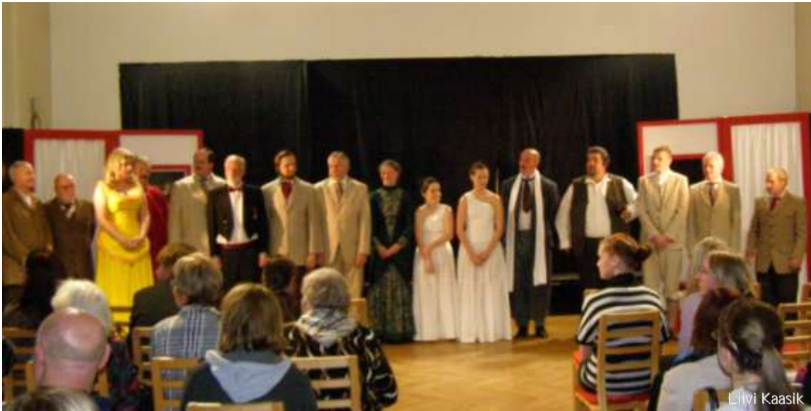
Külalised Saksamaalt - Elmshorni Dittenbühnest etendamas L-Ceglecki komöödiat "Sturmeselle Sokrates".