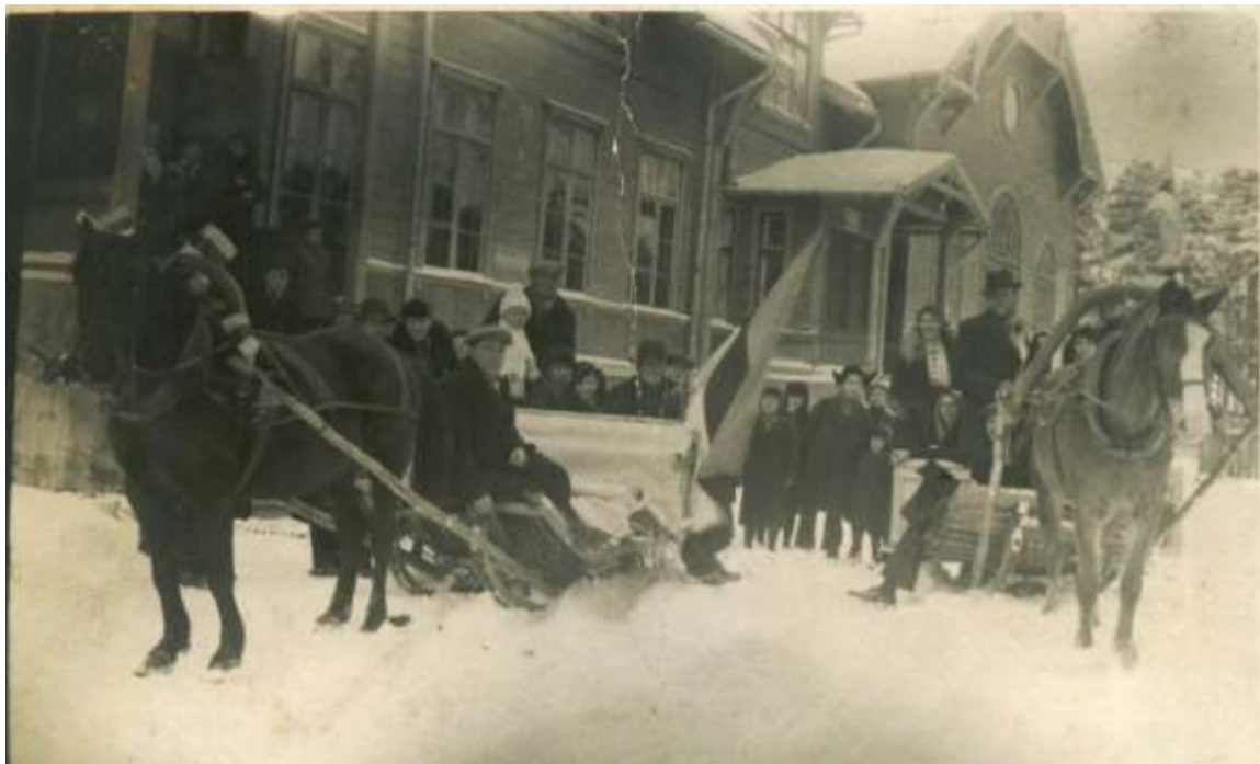
Palume abi! Kes on pildil ja mis teeksil? Info saatke postiga Lembitu 1, 80028 Pärnu või e-postiga ajaleht@raekylavanakool.ee.