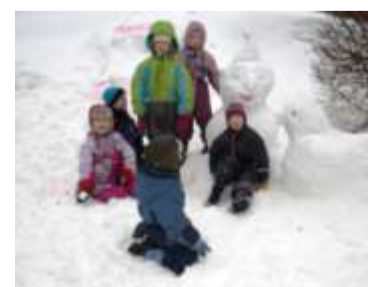
Raeküla siisikesed lasteaia õuel.

Tagasiside koos veedetud ajast oli ootuspäraselt rõõmustav. Meie, Raeküla lasteaia väikesed siisikesed, hakkasime ootama järgmist kohtumist oma uute sõpradega. Kokkusaamine saigi teoks asja möödunud sõbrapäeval. Oh väga tore omada sõpru, kes sind ootavad. Kuidas leida sõpru? Vastus on väga lihtne - ole ise talepanelik sõber.