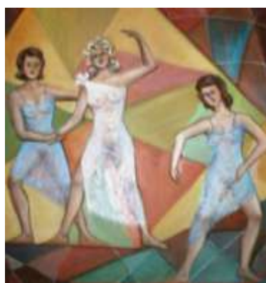
Varietee, 1985, kubism