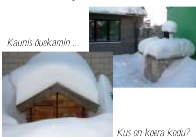
Kaunis öuekamin ...