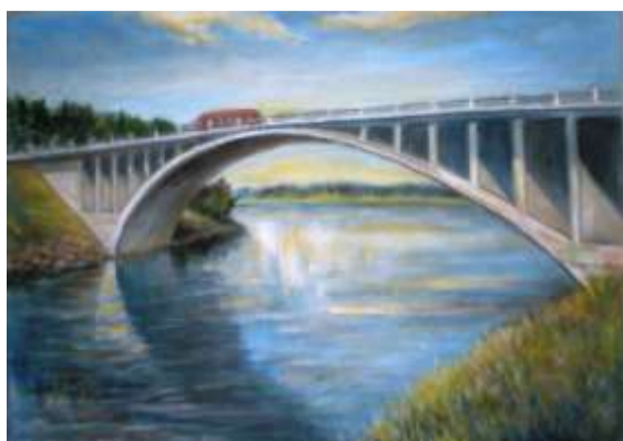
Reiu sild, 1979, õli

Päris esimene näitus on Osvald Saulepil siiski hästi meeles – see sai kodupaiga rahvale tänuks Kehtna soovhoosi kontoris üles seatud just Tartu kunstikooli õpingute viimasel päeval.