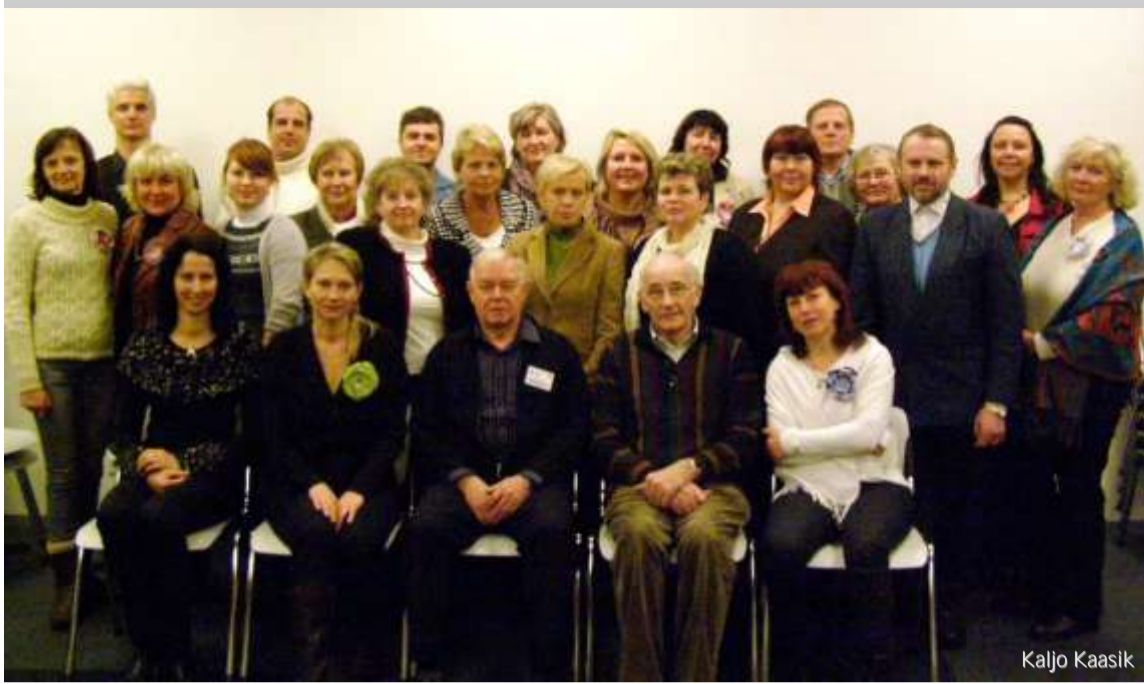
Baltikumi Y's klubide koolitus Riias.