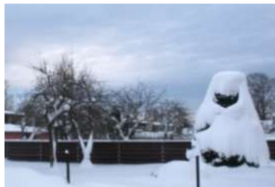
Lumi mähkis kuuse suurrätti.