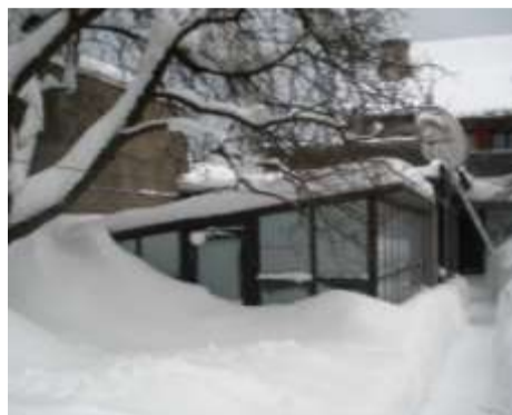
Lumi mattis enese alla üle kahe meetri kõrguse kasvuhoone