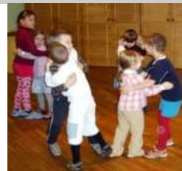
Raeküla siisikesed Mai lasteaias.

Kui praegune projekt tekitab uue liikumistee Papiniidu ja Raeküla raudteejaama vahele ja rekonstrueeritakse Paide - Riia maantee ristmik, siis tulevikuprojekt viib liikluse Via Baltical hoopiski Pärnust mööda Sindi tagant.