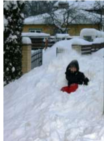
Igast hangest on lastele rõõmu.

MTÜ Selts Raeküla pöördub kõigi hea tahetega inimeste, firmade ja organisatsioonide poole abipalvega toetada lehe väljaandmist kas ülekandega meie arveldusarvele või pistes oma toetus meie keskses asuvasse korjanduskarpi.