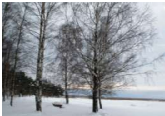
Talvine vaikus Raeküla jaanituleplatsil