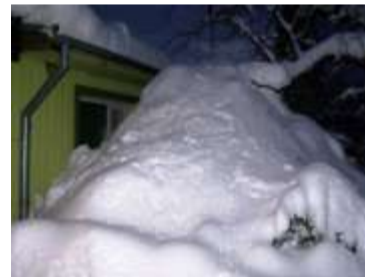
Tiidu amm ei näe aknast välja.