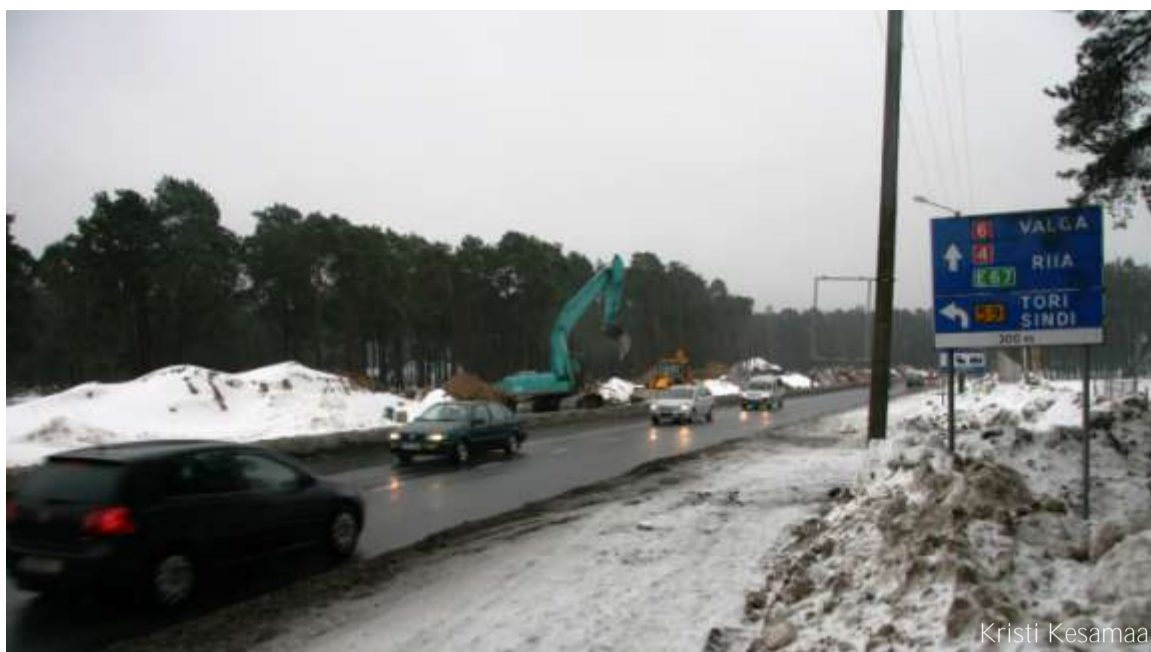
Liiklus Raeküla piires Riia ja Paide maanteel on tee-ehitusest häiritud veel vähemasti hilissügiseni.