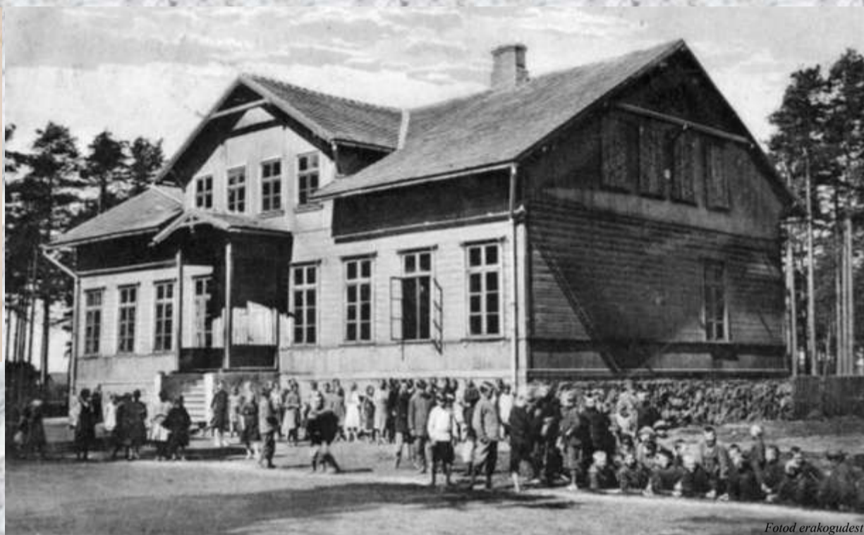
Pärnu-Maremetse alalinna kool