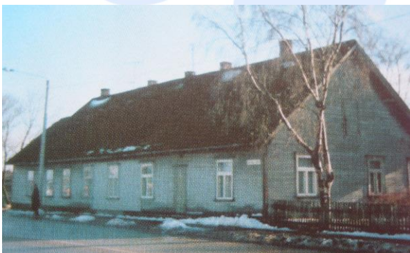
Sild üle Sauga jõe sai nimeks Siimu sild, Vana-Pärnu poolelt sillaga tõtt vaatava Siimu kõrtsi järgi.