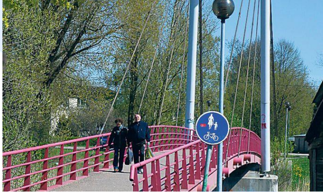
Jalakäijate sild üle Sauga jõe avati pidulikult 2. novembril 1998.

Silla avapäev – 2. november 1998 – on kindlalt jäädvustunud Vana-Pärnu eluloosse. Konstruksioonilt vantsild on 75 meetrit pikk ja kolm meetrit lai, silla ehitus läks linnale maksma 1,85 miljonit krooni.