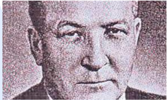
Pilt on võetud internetist.