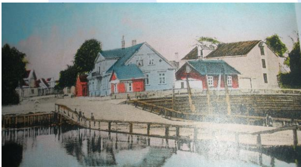
Esimene sild, nn. Nahksild üle Sauga jõe, mis ühendas Vana-Pärnu Pärntu Ülejõe eeslinnaga, valmis 19. sajandi kahekümnendail (paar aastakümnet pärast üle Pärnu jõe ehitatud silla avamist). Sild täitis oma ülesandeid üle saja aasta. Pilt on pärit vanalt postkaardilt.

Silla ehitamisega üle Pärnu jõe algas otsetee ehitamine Tallinna poole, mis esialgu kandis Jänesselja tänava (uulitsa) nimetust. Tänav sai nime Jänesselja mõisa järgi, mis asus praeguse Sauga aleviku kohal.