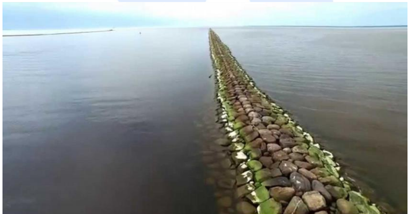
Mõlemad pildid on võetud internetist.