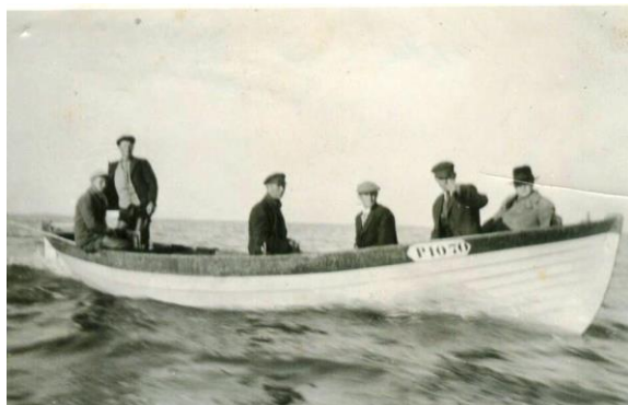
Raeküla kalurid.

20. sajandi alguses oli Raeküla elanike põhiliseks tegevusalaks kalapüük. Veel käidi tööl Waldhofi tselluloosivabrikus, saeveskis Lennuk, Sindi kalevivabrikus ja Sindi-Lodja tellisetehases. Kõige jõukamalt elasid just kaluripered.