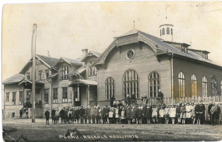
Pärnu Raeküla koolimaja, 1930.