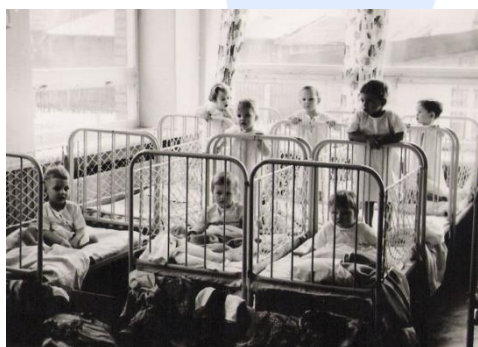
Raeküla lasteaed algusaastail.

Lasteaed tegutses Raekülas Lembitu 1 hoones kooliga koos juba 1931. aastal, praegune Pärnu Raeküla lasteaed avati 1966. aastal. Tol ajal kandis asutus nime Pärnu Linna 16. Lastepäevakodu. Üks kahest sõimerühmast tegutses ööpäevaringselt. Seitsmekümnendatel aastatel loodi eraldi rühmad raskete kõnedefektidega lastele. Alates 2004. aastast on asutuses üks tasandusrühm kõnehäirete ja spetsiifiliste arenguhäiretega lastele.