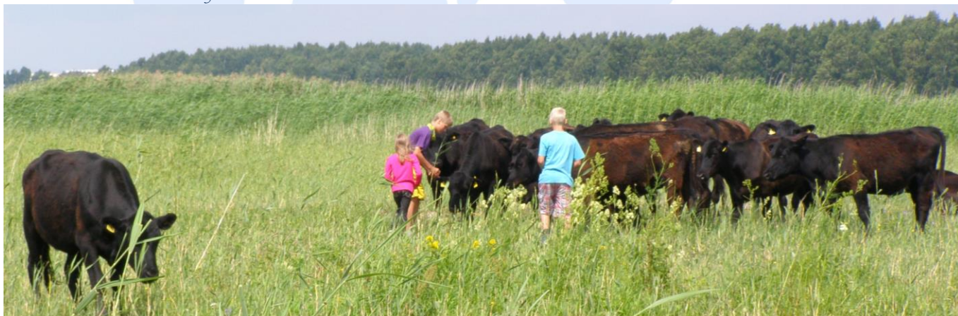
Lihaveised 2013. a Raeküla rannaniitudel rohtu nosimas ja kohalikud noored veistega sõprust loomas.