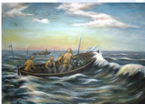
Suurele püügile, 1982, õli.