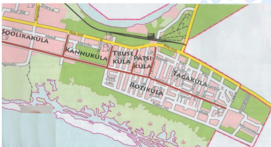
Raeküla linnaosa kaart, mille koostamisel on kasutatud infot eelmise sajandi alguskümnendest.