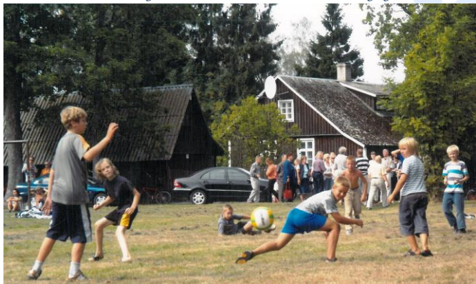
20. august 2006. a linnaosade päeva tähistamine Sepa platsil. Käimas on linnaosadevaheline rahvastepallivõistlus.