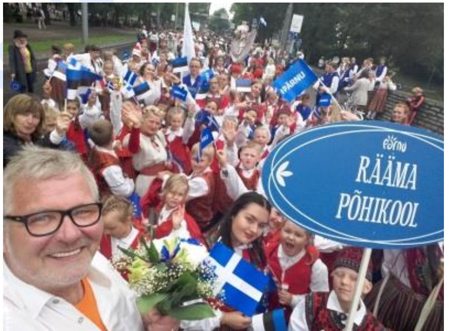
Rääma kooli esindus laulu- ja tantsupeo rongkäigul 2017.