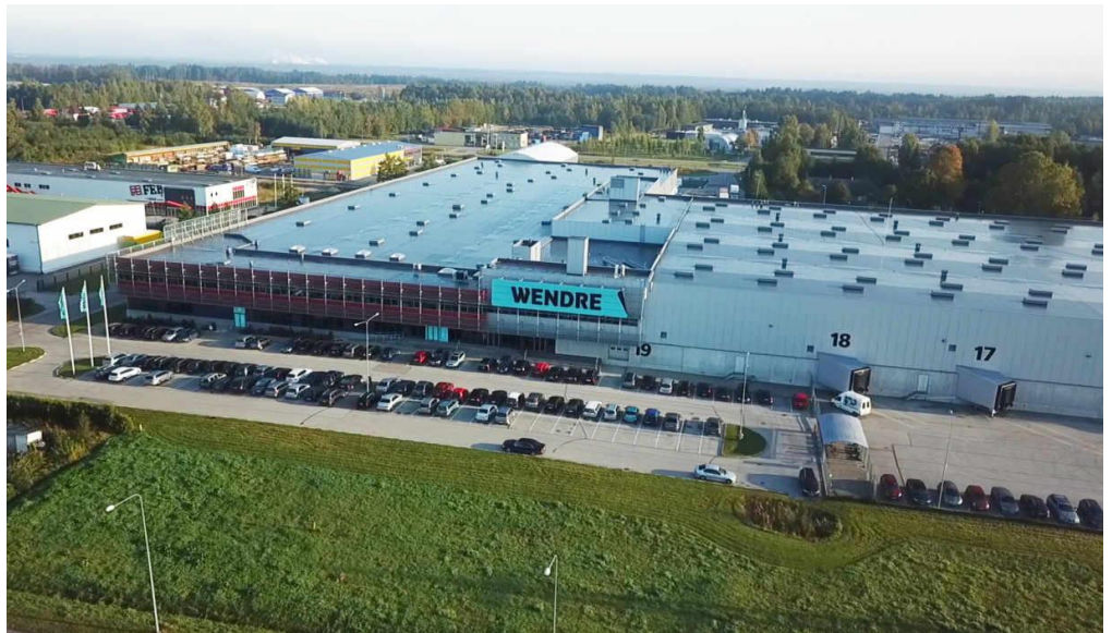
Wendre tootmishoone aadressil Lina 31.

Hea ettevalmistus ega inimeste leidmine on Wendre jaoks väga oluline ja seda mitte ainult Pärnumaa elanikkonna seast.