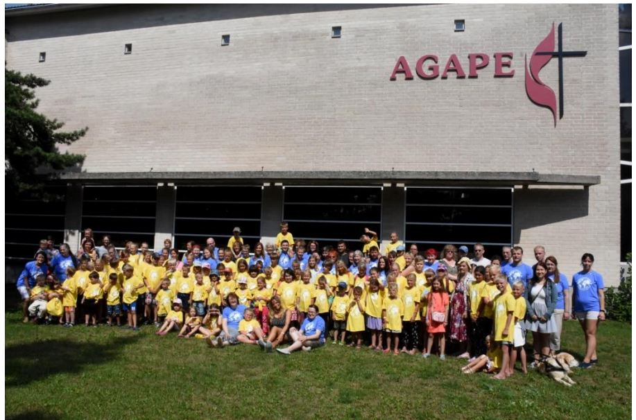
Agape Laste Suvekool.

AGAPE kirik on avatud ja loomingu- lise mõtlemisega aktiivne kogudus. AGAPE kogudus toetub ajaloolisele kristlikule traditsioonile ja suhtub lugupidamisega naabritesse teistes kirikutes.