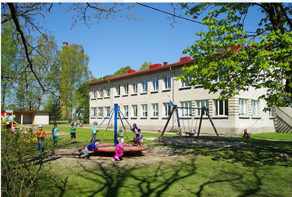
Männipargi lasteaia õueala.

2013. aastal ühines lasteaed MTÜ Lastekaitse Liidu projektiga „Kiusamisest vaba lasteaed”.