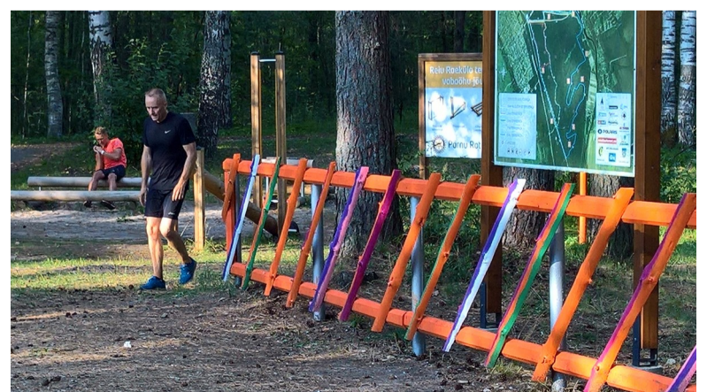
01.08.2018 väsinud tervisesportlane möödumas värvirõõmsast aiast