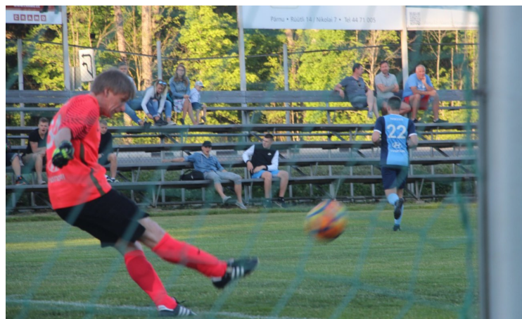
Jalgpalliklubi Poseidon, kelle pesapaik asub Vanakooli keskuses, ning jalgpalliklubi Vaprus jalkalähing 31. mail 2018