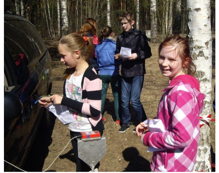
Fotol noororienteerujad Raeküla koolist

Seitsmes Pärnu koolinoorte orienteerumine (2017) tuli viia Rannaparki, kuna rahvusvahelise jalgrattavõistlusega Raekülas oli keelatud muid võistlusi seal korraldada.