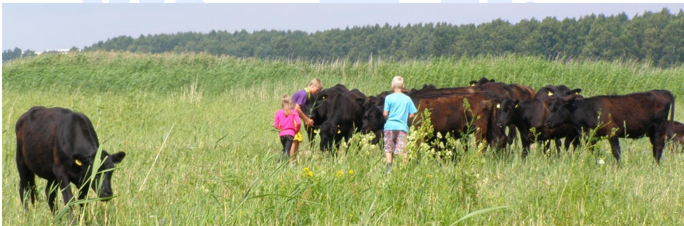
Коровы хайлендской породы в 2013 г. на выгулах Разкюла щиплят траву и местная молодежь заводит дружбу с коровами.

Посмотри в сторону моря и представ, что еще полстолетия назад вместо простирающегося лесопарка был выгул, где местные жители пасли своих коров. Тогда не было в Разкюла современных частных домов, а напоминающих хутора дворы, где выращивали продукты полеводства и держали скот. Эти с красивыми садами дома, которыми сейчас любимы, построены в большинстве уже в 1960 годы.