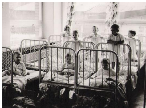
Детсад Разкюла в начальные годы. Фото из частного собрания

Детсад Разкюла действовал вместе со школой в помещении Лембиту 1 уже в 1931 году, нынешний детсад Разкюла открыли в 1966 году. В то время заведение называлось Детский дневной дом №.16 города Пярну. Один из двух ясельных групп действовал круглосуточно. В семидесятые годы образовали отдельные группы для детей с тяжелыми дефектами речи. Начиная с 2004 года в заведении