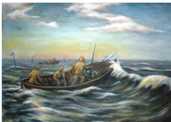
На большую пугину, 1982, масло