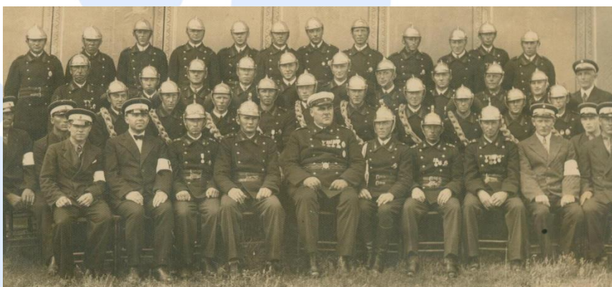
Духовой хор пожарных Раэкюла, 1935.

Ныне заменяет здание с вышкой депо частный дом. Находящийся за домом плац, который местные называют Пярна (липовый) парком по посаженным там липовым деревьям, уцелел. Под корни саженцев пожарники - сажальщики оставили записки со своими именами.