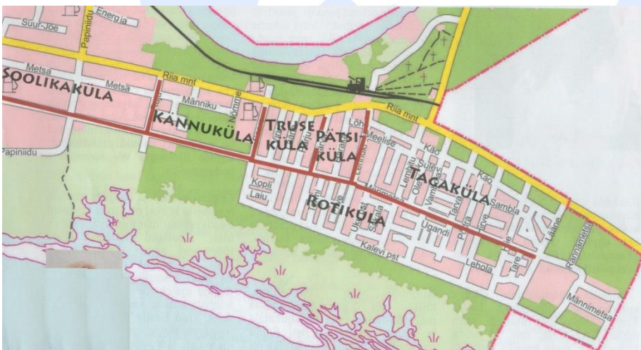
Карта городского района Раэкюла, в составлений которого использованы материалы от начальных десятилетий прошлого столетия.

Может-быть слышал. что Раэкюла называют Крысиной деревней. На самом деле Ротикюла называют только ту часть Раэкюла, где ты сейчас прогуливаешься. На самом деле Раэкюла была разделена даже на шесть деревень. Бывших владении Якоба Пятса между нынешними улицами Лембиту и Ярва иногда называли деревней Пятса, оттуда в сторону города до улицы Сааре была также по имени землевладельца деревней Труше. От улицы Сааре до улицы Рая оставалась Кяннукула (деревня ПНЕЙ). Так как нынешних высотных домов в районе Май еще построено небыло, считалось что Раэкюла простирается аж до улицы А.Х. Таммсааре. Отрезок между улицей Метса и Рижское шоссе называли Сооликакула (кишечная – ..). От деревни Пятса в сторону Риги оставалась Тагакюла (задняя-..) и все что находилась от улицы Мериметса в сторону моря--это и было злое Ротикюла. Легенд, почему Ротикюла прозвали Ротикюла, в народе ходит много. Более распространенные;