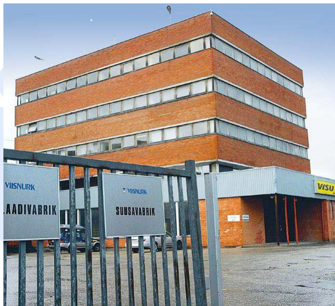
Лыжная фабрика Вииснурк.

Кроме даренных Вииснурком 95 пар лыж на выставке много лыж из частных собрании и из своих запасов, а также лыжные палки