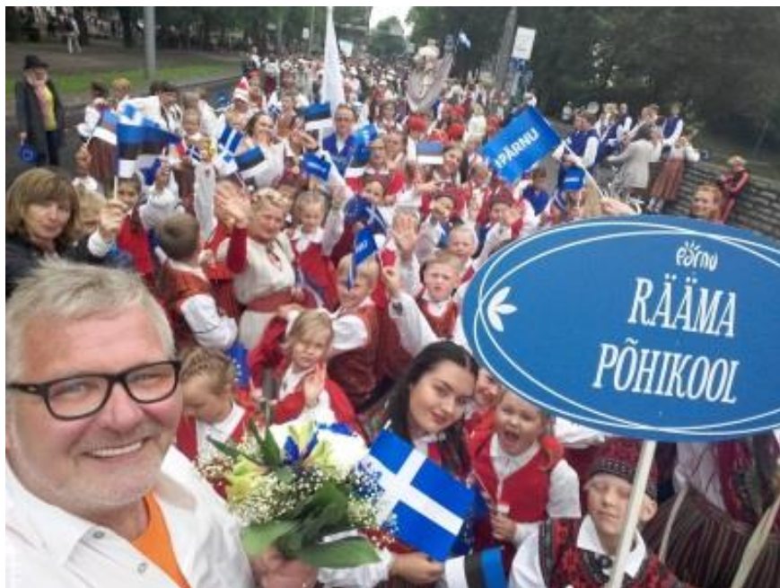
Представительство школы в Ряяма на торжественном шествии праздника песни и танца 2017.

1944\45 уч\г школа получила название Ряяма неполная 5-ая средняя школа.