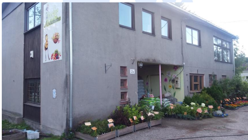
Здание Общества Садоводства и Пчеловодства Пярну на ул. Аллика

Отчетно-выборное собрание 1980 года проводилось уже в нашем собственном зале. В Пярнуском ОСП проводилась усердная и постоянная хозяйственная деятельность и культурной деятельностью в пределах республики Пярнуская ОСП было постоянно среди трех первых.