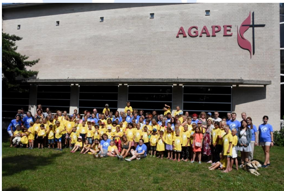
Летняя Школа Агапе.