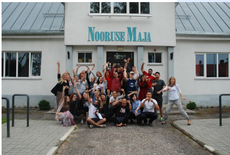
Обучение работников с молодежью в Ноорусе Мая.

Устав зарегистрировали и затем 14-го октября 1923 года провели учредительное собрание общества в здании старой школы Ряяма.