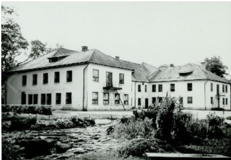
Перестроенное главное здание мызы Рязма 1977 г.