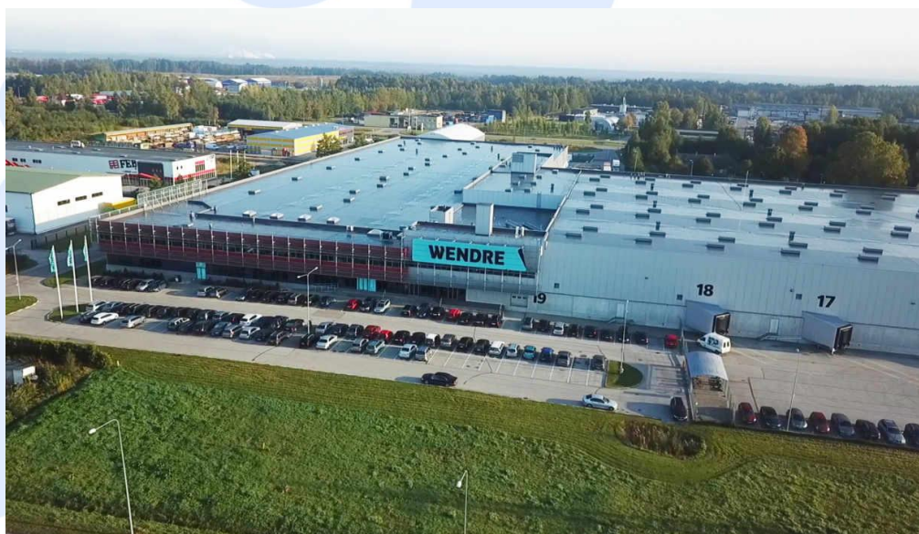
Производственное здание Вендре по адресу Лина 31.