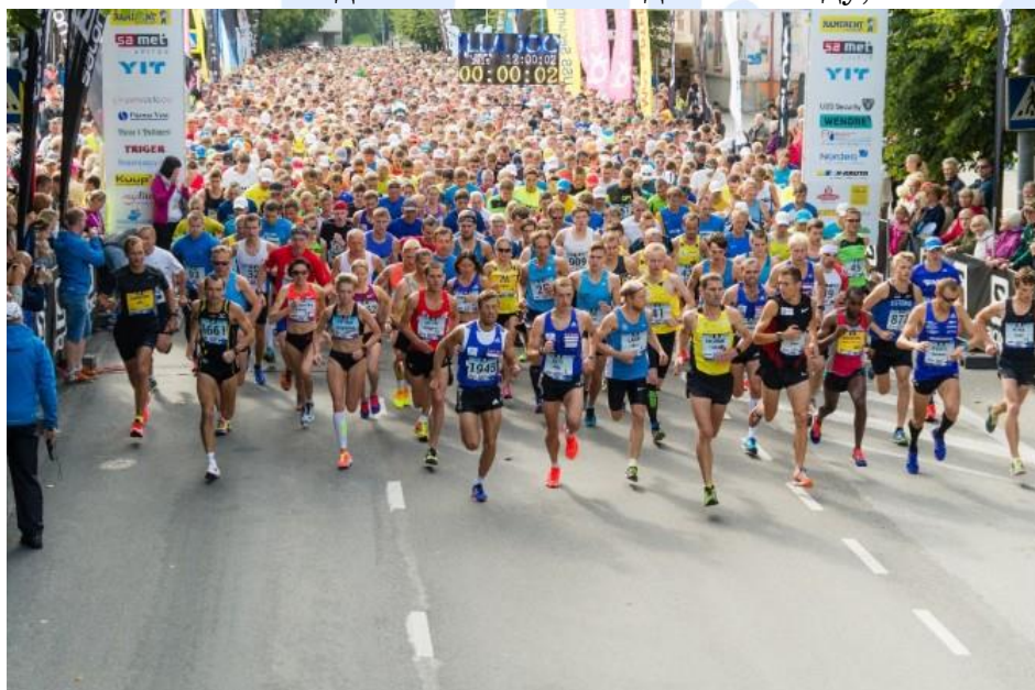
Пробегка между двумя мостами по тропе Яансона.

больше, чем на тропе другого берега реки.