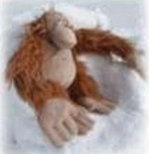
FELIX RVK ANK maskott