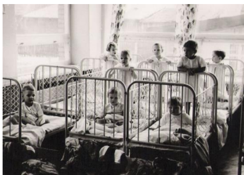
Детсад Раэкюла в начальные годы.

Детсад Раэкюла действовал вместе со школой в помещении Лембиту 1 уже в 1931 году, нынешний детсад Раэкюла открыли в 1966 году. В то время заведение называлось Детский дневной дом №.16 города Пярну. Один из двух ясельных групп действовал круглосуточно. В семидесятые годы образовали отдельные группы для детей с тяжелыми дефектами речи. Начиная с 2004 года в заведении есть одна уравнительная группа с дефектами речи и