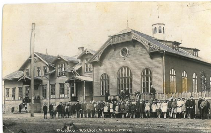
Здание школы в Разкюла, Пярну 1930.