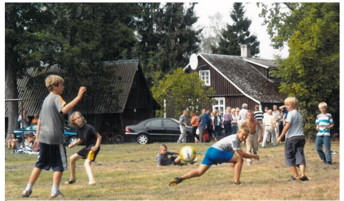
20-го августа 2006 празднование Дня районов города на плацу Сепя. Идет соревнование по национальной игре с мячом.