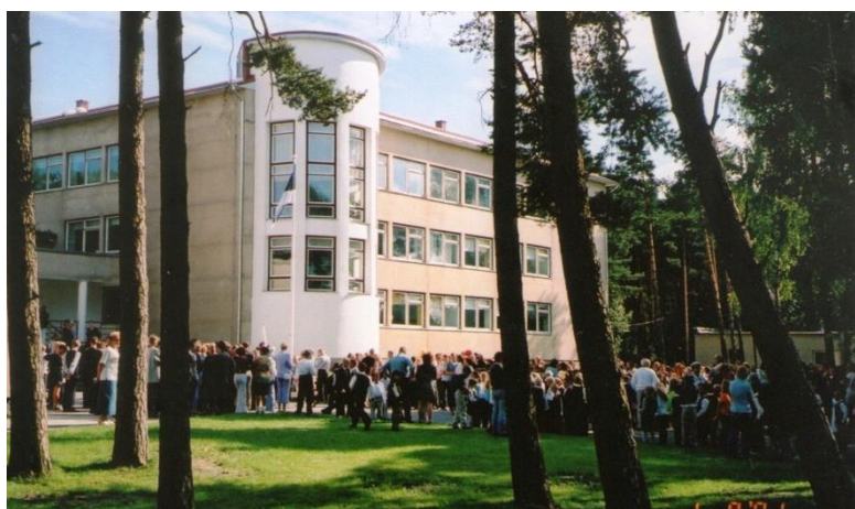
1.09.2001. Учениники, учителя и др. Пярнуской Гимназий Разкюла собираются для шествия в центр МАЙ.