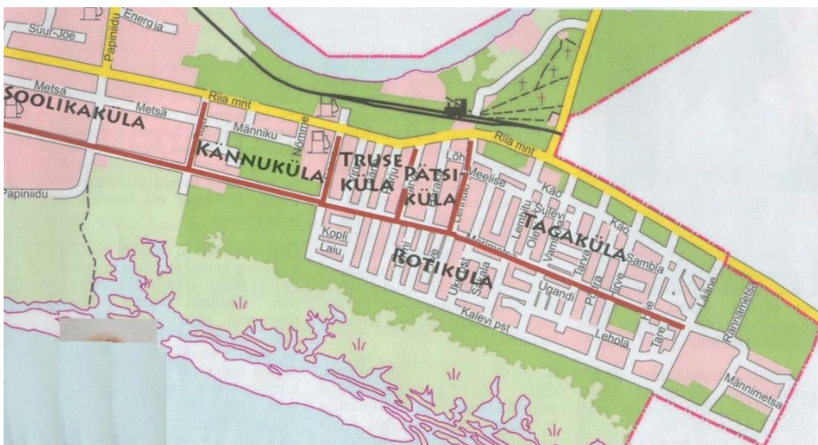
Карта городского района Разкюла, в составлений которого использованы материалы от начальных десятилетий прошлого столетия.