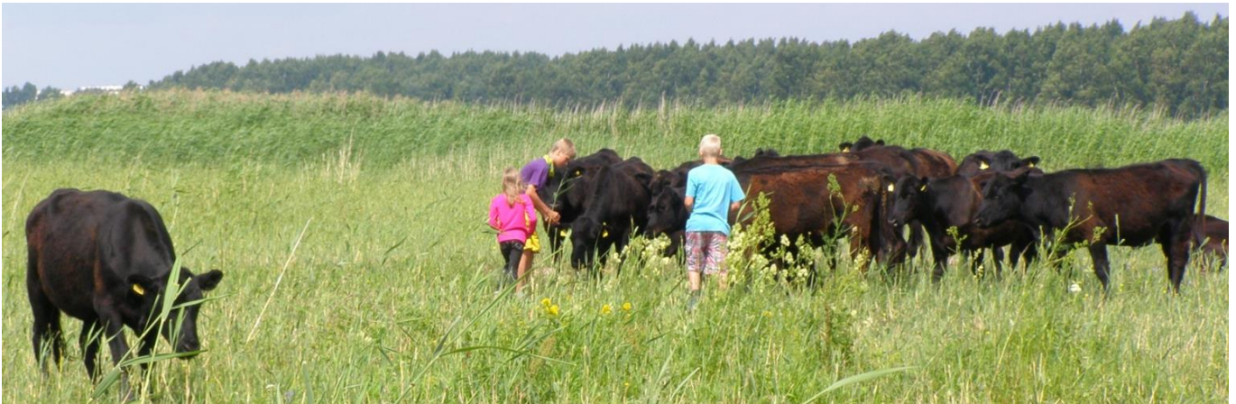
Коровы хайлендской породы в 2013 г. на выгулах Разкюла щиплят траву и местная молодежь заводит дружбу с коровами.

Посмотри в сторону моря и представ, что еще полстолетия назад вместо простирающегося лесопарка был выгул, где местные жители пасли своих коров. Тогда не было в Разкюла современных частных домов, а напоминающих хутора дворы, где выращивали продукты полеводства и держали скот. Эти с красивыми садами дома, которыми сейчас любуемся, построены в большинстве уже в 1960 годы.