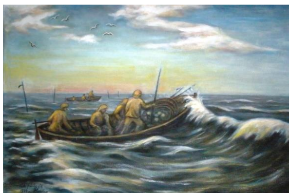
На большую пугину, 1982, масло