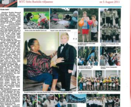
Teeme Raeküla taas Pärnu väravaks

Teeme Raeküla taas Pärnu väravaks. Teeme Raeküla taas Pärnu väravaks. Teeme Raeküla taas Pärnu väravaks.