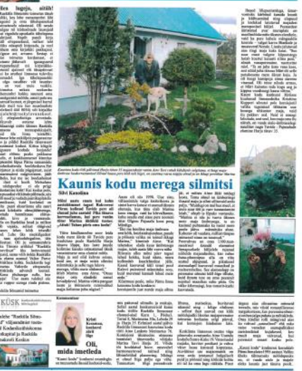
Kaunis kodu merega silmitsi

Kaunis kodu merega silmitsi. Kaunis kodu merega silmitsi. Kaunis kodu merega silmitsi.