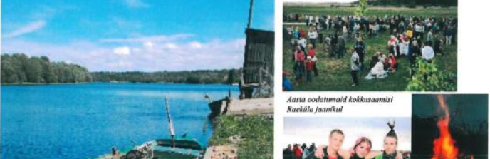
Aasta oodatuid kokkusaamisi Raeküla jaanikal