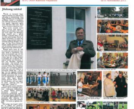
Jaamahoone saatus pole veel otsustatud

Jaamahoone saatus pole veel otsustatud. Jaamahoone saatus pole veel otsustatud. Jaamahoone saatus pole veel otsustatud.