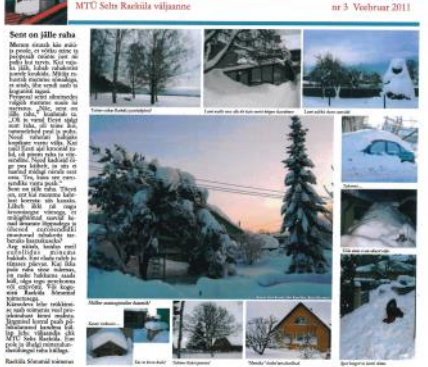
Muutus looduses on ikka märgata

Muutus looduses on ikka märgata. Muutus looduses on ikka märgata. Muutus looduses on ikka märgata.