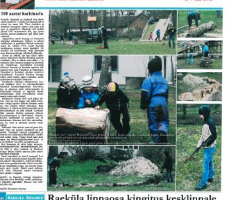
100 aastat barisõestu

100 aastat barisõestu. 100 aastat barisõestu. 100 aastat barisõestu.