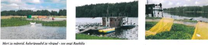
Meri ja määnd, kaluripaavid ja võrgud - see ongi Raeküla

Kõik, kes selle ja tulevaseki lehed kokku panevad, teevad seda "aitäh" eest. Sestap loodame, et viiakesarvuline toimetuspere jõuab linna ratta suurepele kirja ja sõbralikus üksmeelsest tegevuses poie karta pööda headest mõtetest.