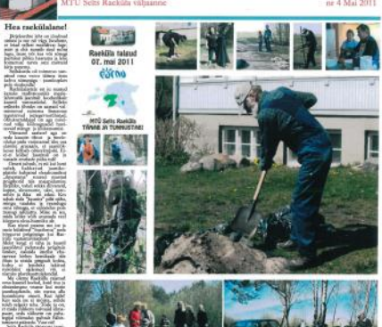
Rannaniidud jäävad niimata

Rannaniidud jäävad niimata. Rannaniidud jäävad niimata. Rannaniidud jäävad niimata.