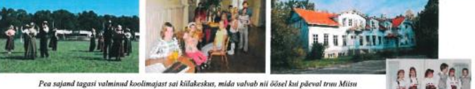
Kolm korda Raeküla - selts, keskus, sõnumid

2001. aastal tulid kokku üheksa inimest, kes valitsid sõnumitööst Raeküla koolihoone piirast. Loodi MTÜ Selts Raeküla. Teemad on: ettevõtmistest on linnaosa elanikele ja külalistele teada andud nii koolile kui ka Pärnu Postimehe vahendusel. Nüüd on linnaosas uus infokanal - väljaanne Raeküla Sõnumid. Lehe väljaandmist toetab Kodanikuühiskonna Sihtkapital, Selts Raeküla ja paljud vabatahtlikud - TÄNU NEILE!