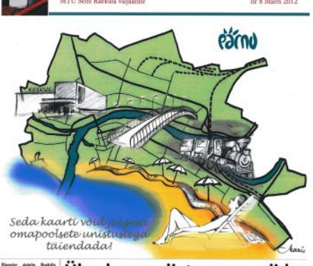
Seda kaarti võid saama omapoolete ühistööga täiendada!

Üheskoos selgitame reeglid. Üheskoos selgitame reeglid. Üheskoos selgitame reeglid.